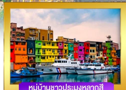
หมู่บ้านชาวประมงหลากสี