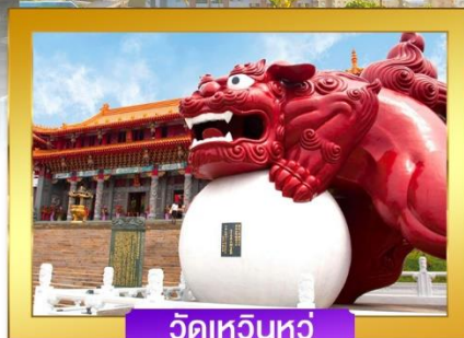
วัดเหวินหู