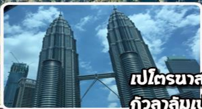
เปโตรนาสทาวเวอร์ กัวลาลัมเปอร์